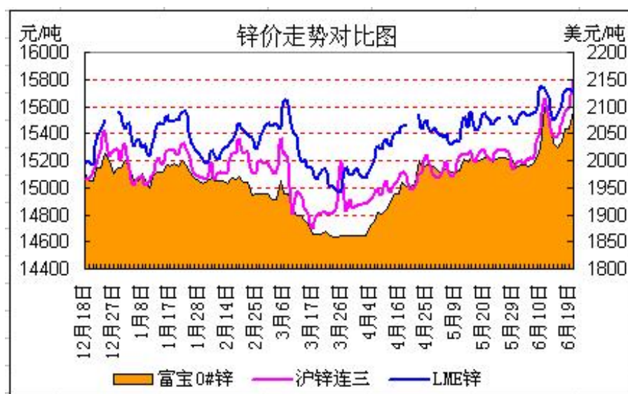
图 1：富宝 0#锌、沪锌、LME 锌走势图

看涨热情被点燃，本周两市锌价再攀升高位。国际铅锌研究小组（ILZSG）周一公布的数据显示，2014 年 1-4 月全球锌市供应短缺 107,000 吨。短缺及低库存仍是目前市场主要关注点，市场机构多唱多锌价，伦锌创 16 个月新高，截至周五亚盘伦锌维持 2170 美元/吨附近，周涨幅近 4%。国内方面，沪锌主力周上涨仅有 2.28%，上涨乏力主因国内锌基本面想多偏弱。现锌市场，国内主流上涨至 1.56 万附近，与此前不同，市场买涨不买跌心理再次显现。临近周末，部分终端企业采购，市场成交有起色。