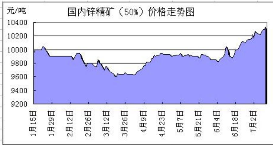
图 2：锌精矿行情走势图

截至周五多地区锌精矿价格维持在 10230-10430 元/金属吨（50%，含税）附近。冶炼厂继续占据主导权，采购价格相对苛刻且结账缓慢致锌矿难销售，且价格表现滞涨，市场整体成交欠佳。消息面上，湖南常宁塔下矿预期提交锡铅锌资源量 10 万吨；累计投资 13 亿元的乌拉特后旗紫金 330 万吨/年铅锌矿采选项目现已建成投入试生产。虽国外锌矿面临停产，但国内对新型矿山勘探及开采力度仍较大。不过全面释放产能或仍需时间，但锌矿资源外紧内松的局面或将长期形成。