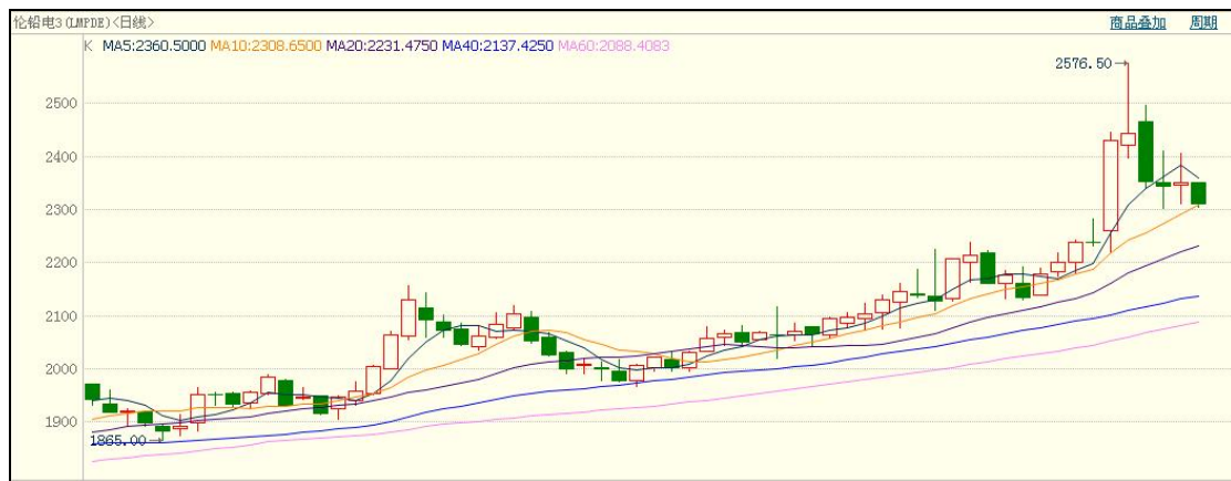
图 1： 伦铅走势图